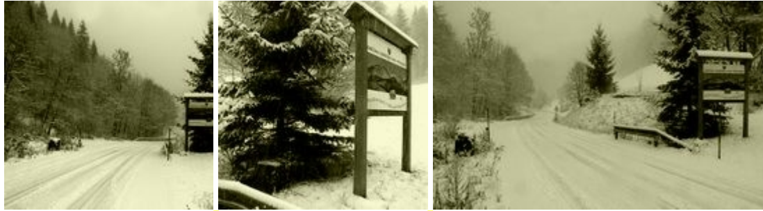
Mejni prehod v Podlanišču leta 1945 in ob Priključitvi Rapalske ostaline v Podlanišču novembra 2010

Na svoj način lahko kulturnozgodovinsko in turistično obeležimo mejno spomeniško dediščino kot to delajo drugod po svetu. Svetovno znani in razglašeni je berlinski Chek point Charly , v sosednji deželi v Italiji, ki je nekoč večinoma spadala pod Avstrijo, so pred desetletji obnovili stare kažipote in mejnike, na Tablji v Kanalski dolini so kamnite mejnike potegnili iz potoka, kamor so jih bili zmetali in so tam ležali petdeset let. Podobno so naredili tudi na Tratah, a postavljen posebni mejnik 43 že dolgo čaka restavracije. Na Goriškem in v Furlaniji so obnovili zelo stare mejnike med Beneško republiko in avstrijskim cesarstvom, v občini Foljan-Sredipolje so kopijo mejnika z beneškim levom in avstrijskim dvoglavim orlom celo dali kovati kot občinsko plaketo (medaljo). V Trivignanu pri Palmanovi je restavracija Pri stari carini ( Alla vecchia dogana ), prodajajo tudi stare razglednice in mejne spominke.