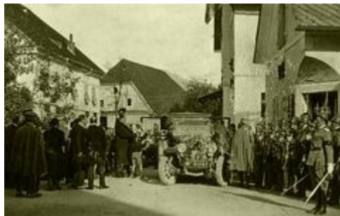
Obisk princa Umberta Savojskega v Cerknem

Sacro egoismo italiano , sveti italijanski egoizem, izraz italijanskega ministrskega predsednika Salandre, naj bi pomenil upravičeno in sveto uresničevanje domovinske ljubezni, dopolnitev in razširitev risorgimenta s poseganjem po ozemljih, kjer so živeli Italijani pod tujo oblastjo, pa tudi tistih, ki so bila mešana ali sploh slovanska, tujerodna, kot so govorili, da ne bi omenili Slovencev in Hrvatov. Ta italijanska narodnostna politika se je kazala že takoj po združitvi Italije pred stopetdesetimi leti pod savojsko dinastijo.