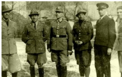
Zgodovinsko srečanje v Podlanišču