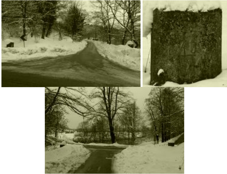
Rapalska ostalina ob cesti med Planino in Uncem

In Mlakar najde v kruti stvarnosti tudi trohico optimizma, ko zapiše sledečo prepričljivo in bistro trditev: