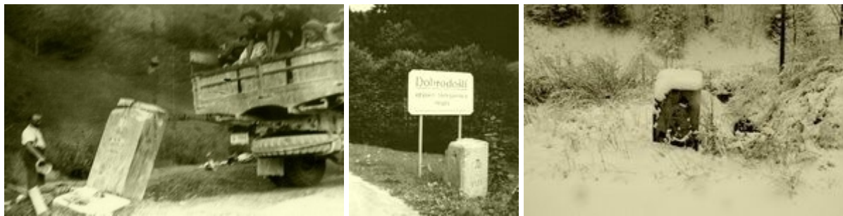
Podiranje mejnikov ob Priključitvi in ista rapalska ostalina danes

Na svoj način lahko kulturnozgodovinsko in turistično obeležimo mejno spomeniško dediščino kot to delajo drugod po svetu. Svetovno znani in razglašeni je berlinski Chek point Charly , v sosednji deželi v Italiji, ki je nekoč večinoma spadala pod Avstrijo, so pred desetletji obnovili stare kažipote in mejnike, na Tablji v Kanalski dolini so kamnite mejnike potegnili iz potoka, kamor so jih bili zmetali in so tam ležali petdeset let. Podobno so naredili tudi na Tratah, a postavljen posebni mejnik 43 že dolgo čaka restavracije. Na Goriškem in v Furlaniji so obnovili zelo stare mejnike med Beneško republiko in avstrijskim cesarstvom, v občini Foljan-Sredipolje so kopijo mejnika z beneškim levom in avstrijskim dvoglavim orlom celo dali kovati kot občinsko plaketo (medaljo). V Trivignanu pri Palmanovi je restavracija Pri stari carini ( Alla vecchia dogana ), prodajajo tudi stare razglednice in mejne spominke.