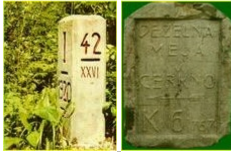
Rapalski kamen Deželni kamen

Sacro egoismo italiano , sveti italijanski egoizem, izraz italijanskega ministrskega predsednika Salandre, naj bi pomenil upravičeno in sveto uresničevanje domovinske ljubezni, dopolnitev in razširitev risorgimenta s poseganjem po ozemljih, kjer so živeli Italijani pod tujo oblastjo, pa tudi tistih, ki so bila mešana ali sploh slovanska, tujerodna, kot so govorili, da ne bi omenili Slovencev in Hrvatov. Ta italijanska narodnostna politika se je kazala že takoj po združitvi Italije pred stopetdesetimi leti pod savojsko dinastijo.