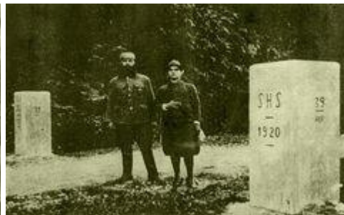
Mejni prehod ob cesti Žiri - Idrija

Teh nekaj prebliskov iz zgodovine me obhaja danes, ko tu v Žireh na sami nekdanji stari meji na mednarodnem simpoziju z nastopi, ki z raznih vidikov, predvsem seveda z obrambno-utrdbeniško-spomeniškega pomena govorijo o nekdanji meji. To je bila meja, ki je zaradi podpisa zadevne pogodbe dobila ime po turističnem kraju Rapallo na italijanski ligurski obali.