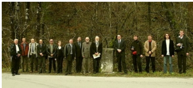
Udeleženci mednarodnega simpozija ob 39. mejniku

Turistično privlačen in pomemben je prehod pri Hotedršici, ki skupaj z Godoviškim zemljepisnim prevalom loči, tudi po mednarodni klasifikaciji, Alpski svet od Dinarskega. Mislím seveda na italijansko poškodovano stražnico v obliki bunkerja, ki že dobrih šestdeset let kot izgubljeno strašilo vojnih razmer bega potnike, ki se vozijo po Keltiki. Stražnica je prvovrstna spomeniška dediščina rapalske meje, ki bi jo bilo treba urediti in opremiti s pojasnili. To bi koristilo mnogim, ki jih zanima narodna zgodovina, in bi popravilo sedanji grdi krajinski videz zaradi vojne ruševine. Pri Šempetru ali Vrtojbi so neki zapuščeni stražni stolp ob sedanji meji spremenili v privlačen mini muzej!