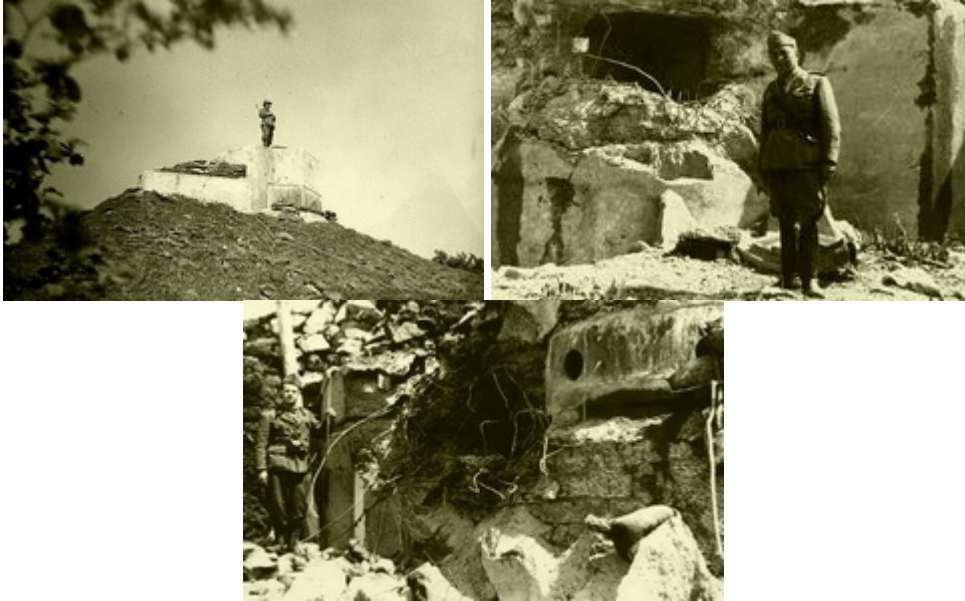
Italijanski vojak na bunkerju Rupnikove linije in njeno uničevanje (sredina leta 1941)

spremljata pa nas tudi dva obrambna sistema, morda bi pri tem smeli reči, da je bil jugoslovanski (slovenski) zares predvsem obrambni, medtem ko je bil italijanski v nekem delu tudi napadalni. Za te naprave velikega, lahko bi rekli evropskega obsega, sta znani poimenovanji Rupnikova črta ali Rupnikova linija na vzhodni strani in Alpski zid ( Vallo Alpino ) na zahodni strani rapalske meje.