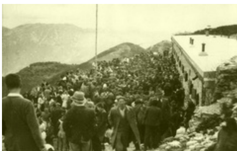
Kaverni na Črnem vrhu in Poreznu že od davna služita drugemu namenu

Turistično privlačen in pomemben je prehod pri Hotedršici, ki skupaj z Godoviškim zemljepisnim prevalom loči, tudi po mednarodni klasifikaciji, Alpski svet od Dinarskega. Mislím seveda na italijansko poškodovano stražnico v obliki bunkerja, ki že dobrih šestdeset let kot izgubljeno strašilo vojnih razmer bega potnike, ki se vozijo po Keltiki. Stražnica je prvovrstna spomeniška dediščina rapalske meje, ki bi jo bilo treba urediti in opremiti s pojasnili. To bi koristilo mnogim, ki jih zanima narodna zgodovina, in bi popravilo sedanji grdi krajinski videz zaradi vojne ruševine. Pri Šempetru ali Vrtojbi so neki zapuščeni stražni stolp ob sedanji meji spremenili v privlačen mini muzej!