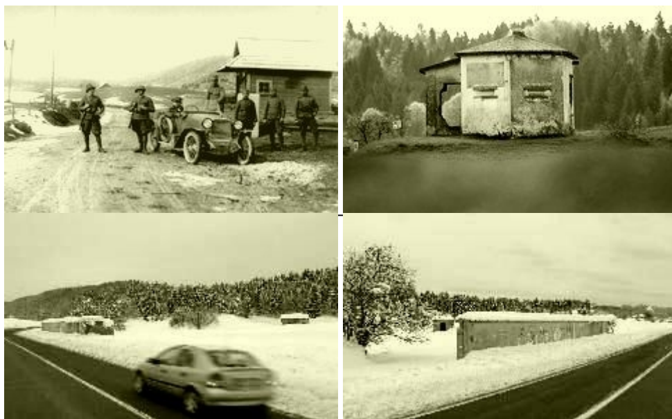
Mejni prehod Hotederšica nekdanj, jugoslovanska stražnica in zid nekdanje italijanske stražnice danes

Na podlagi že posnetih dokumentarni filmov in novih dognanj naj bi izdelali nov, celovitnejši filmski zapis. Treba bi bilo očistiti in restavrirati nekatere pomembne mejnike na prometnih in višinskih točkah. Najprej mislim na glavni mejnik 38 v Mrzlem Vrhu. (kota 983 m), ki stoji natančno na meji med Idrijo in Gorenjo vasjo-Poljanami, na izjemno lepem razgledišču, zlasti proti zahodu. Od mejnika lepo vidiš tudi vrh Matajurja, kamor smo leta 1947 premaknili državno mejo. Izredno zanimivo tudi za zgodovinsko učno uro. Na vrhu prelazov ali na dostopnih planinskih točkah z razgledom ponavadi srečamo kako znamenje, ali »pelino«, križ ali kak smerokaz, pogosto pa tudi mizo in sedišče. Tu stoji glavni mejnik, ki je bil med vojnama tudi kraj, kjer so reševali majhne obmejne spore. Nekateri mejniki skrivajo tudi razne tragične skrivnosti. Tu se je odvijalo že več prireditev ob srečanju oziroma na cilju pohodov. V zadnjih časih se je nad tem krajem zgodil krajinski madež, da ne rečem zločin. Ob začetni gradnji planinske kočice, ki bo stala na gričku nad mejnikom na mestu nekdanje jugoslovanske stražnice (karavle), so mejnik skoraj popolnoma zasuli z odvoženo zemljo in kamenjem. Pozneje so ga za silo okopali, a še vedno je ob njem velikanski kup zemlje, ki zastira pogled na eno stran in razgledni točki jemlje lepoto in veljavo.