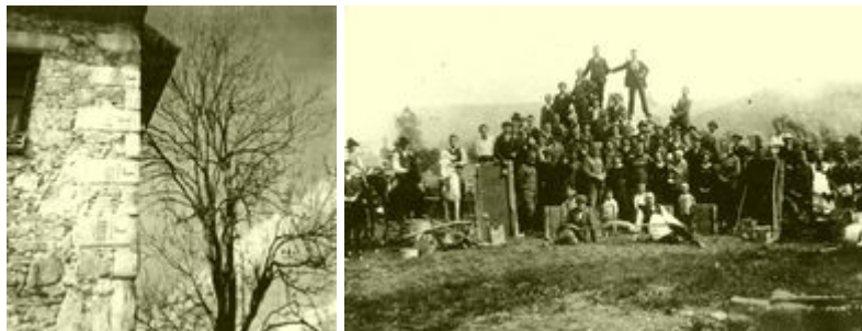
Vzidani mejniki nekje v Davči in zaključek odlivanja mejnikov