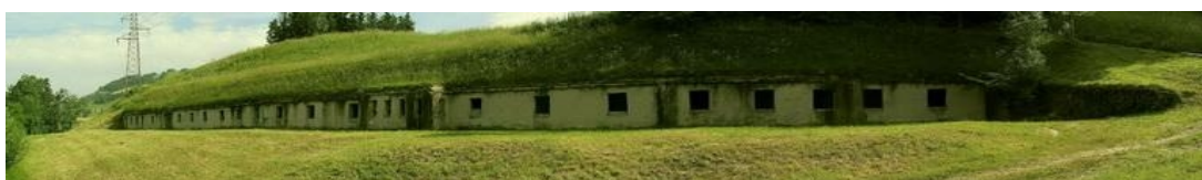
V naravno lepoto vsajena kaverna Kanauc nad Jaznami sameva in propada

Čeprav je italijansko narodno prebujevalno gibanje v obdobju Garibaldija in Mazzinija oznanjalo pravice vseh zatiranih narodov, torej tudi Slovencev, se je italijanska zunanja politika do vzhodnih sosedov napajala iz slave pomorske trgovske države Serenissime ( Beneške republike ); vodila jo je tudi misel, da ima pravico Avstriji iztrgati Trst, Gorico, Istro, celotno Tridentinsko z Južno Tirolsko, in še kos Dalmacije, ker tam ponekod živijo neodrešeni bratje ( fratelli irredenti ), vse drugo, daleč čez narodnostno mejo, pa da ji pripada zato, ker dežela spada k mestu in ker ima Italija zaradi beneške dediščine in njenega zgodovinsko kulturnega in celo jezikovnega vpliva do tega zgodovinske pravice.